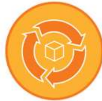
Sourcing & Resource management